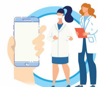
В СЛУЧАЕ ЗАБОЛЕВАНИЯ ОБРАЩАЙТЕСЬ К ВРАЧУ